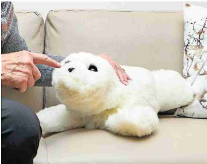
Auf den ersten Blick scheint Robby bloss ein einfaches Plüschtier zu sein.

«Herr T lebt schon sehr in seiner eigenen Welt. Der Robbe konnte er aber sein Innerstes preisgeben.»