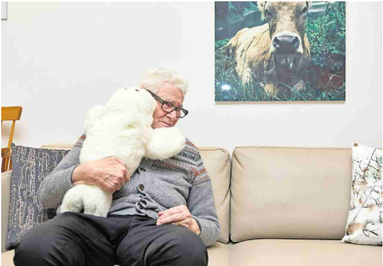
Was wohl Robby Robby Herrn T. alles ins Ohr flüstert?

Die Bewohnenden der Demenzstation im Reusspark Niederwil haben einen tierischen Mitbewohner bekommen, der eigentlich ein Roboter ist.